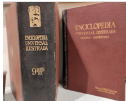
Volúmenes de la Enciclopedia Universal Ilustrada Europeo-Americana , publicados por Hijos de J. Espasa en Barcelona, entre 1911 y 1926.

Supone, por tanto, una novedad que una editorial, casi cien años después de su publicación, siga ofreciendo en el mercado una enciclopedia en 90 tomos, la mayor parte de los cuales están redactados y publicados inicialmente en las primeras décadas del siglo pasado. Aunque los cambios erráticos de los últimos años han provocado un notable desconcierto entre los propietarios y usuarios de la enciclopedia, aún no despejado, al desconocerse la política editorial que seguirá Espasa-Calpe en el futuro.