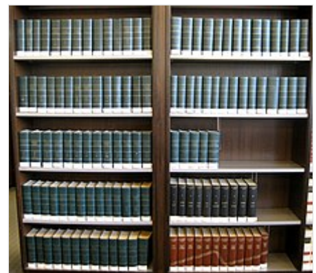
Enciclopedia Espasa en una biblioteca.

En 2005, con motivo del centenario del inicio de su elaboración, formando parte del Suplemento 2003-2004, se ha publicado un volumen conmemorativo titulado El Siglo de la Espasa , que incluye la historia de la Enciclopedia y una antología de artículos. Se editó una nueva Gran Espasa Universal: Enciclopedia Multimedia , adaptación de la Enciclopedia Espasa-Calpe al Siglo XXI, que incluye material editado, corregido y actualizado de la Enciclopedia original del siglo XX más información nueva del presente siglo, consistente en 24 Volúmenes más 1 DVD (o 10 CD-ROM, dependiendo de la opción que se prefiera) con más de 160.000 entradas, 10 000 ilustraciones y 1500 dossiers temáticos, así como archivos de vídeo, sonido, animaciones 3D y otra serie de contenidos en el DVD; y un Portal de Conocimiento en internet que proporciona un servicio de atención personalizado mediante consultas similar al correo electrónico, posibilidad de realizar consultas en tiempo real, acceso a consultas a 9 diccionarios Espasa, una cronología universal temática, una sección de aprendizaje en línea y un servicio de actualización permanente de los artículos enciclopédicos y de los contenidos académicos.