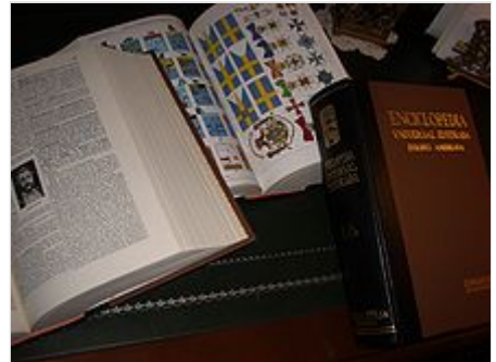
Tres tomos de la enciclopedia donde se aprecian la encuadernación, las láminas en color y algunos artículos.