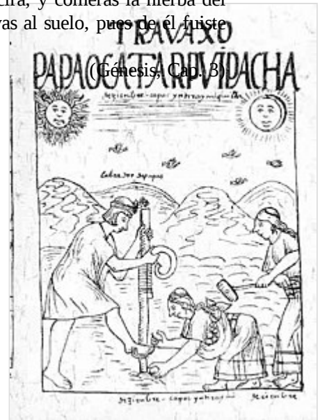
Trabajo en el Tahuantinsuyo . Desde el origen mismo de la humanidad, la labor se ha conformado como una actividad social.

el alimento todos los días de tu vida. Espinas y abrojos te producirá, y comerás la hierba del campo. Con el sudor de tu rostro comerás el pan, hasta que vuelvas al suelo, pues de él fuiste tomado. Porque eres polvo y al polvo tornarás.»