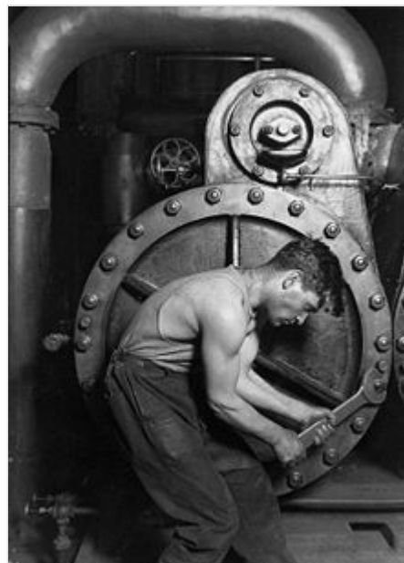
Trabajador estadounidense de comienzos del siglo xx.