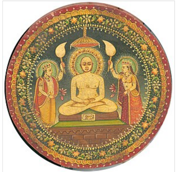
Pintura de Majavirá (en Rayastán , aprox. 1900).