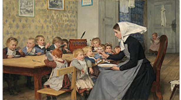
“Die Kinderkrippe” (La guardería), 1890, de Albert Anker .

En cuanto a la ayuda, los experimentos han determinado que, contrariamente a lo que pueda suponerse, la conducta de ayuda suele inhibirse cuantos más espectadores se hallen presentes (el llamado efecto espectador ), ignorancia pluralista. En el modelo de John Darley y B. Latané, 7 la prestación de ayuda incluye cinco pasos consecutivos que, si se resuelven afirmativamente, desembocan en la conducta de ayuda: