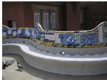
Banco de trencadís del Parque Güell .