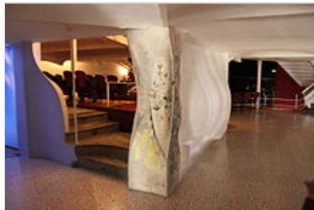
Teatre Metropol de Tarragona