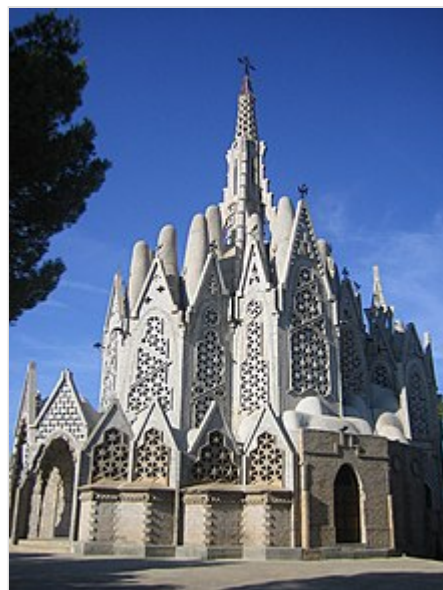
Santuario de Nuestra Señora de Montserrat ( Montferri ).