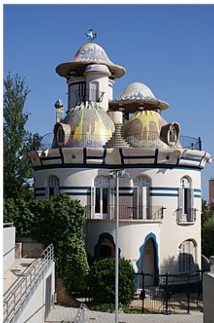
Torre de la Creu, conocida como "Casa dels Ous" ( San Juan Despí ).