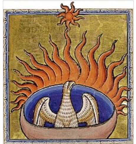
La leyenda del fénix resurgiendo de sus cenizas es una creencia en la resurrección profundamente arraigada en la civilización occidental.

Se han propuesto varias concepciones de las características esenciales de las creencias ( belief ), pero no hay consenso sobre cuál es la correcta. El representacionalismo es la posición tradicionalmente dominante. En su forma más común, sostiene que las creencias son actitudes mentales hacia representaciones, que generalmente se identifican con proposiciones. Estas actitudes forman parte de la constitución interna de la mente que mantiene la actitud. Este punto de vista contrasta con el funcionalismo , que define las creencias no en términos de la constitución interna de la mente, sino en términos de la función o del papel causal desempeñado por ellas. Según el disposicionalismo , las creencias se identifican con disposiciones para comportarse de ciertas maneras. Este punto de vista puede verse como una forma de funcionalismo que