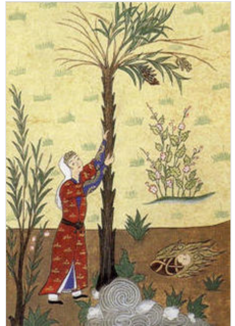
María sacudiendo la palmera para obtener dátiles es una leyenda derivada del Evangelio del pseudo-Mateo .

Si bien se acepta generalmente que el Corán contiene muchos versículos proclamando las maravillas de la naturaleza, Sardar y otros dudan mucho que «todo, desde relatividad, mecánica cuántica, teoría de Big Bang, púlsares y agujeros negros, genética, embriología, geología moderna, termodinámica, incluso el láser