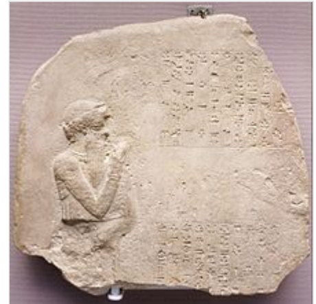
Estela votiva en la que aparece Hammurabi orando.

Las primeras décadas del reinado de Hammurabi fueron bastante pacíficas, y utilizó su poder para llevar a cabo una serie de obras públicas, incluida la mejora de las murallas de la ciudad para propósitos defensivos y la ampliación de los templos. 20 Hacia el