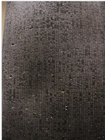
Detalle de la escritura cuneiforme del código de Hammurabi.

En esta estela se hallan grabadas las 282 leyes del Código de Hammurabi , donde el mismo Hammurabi recibe el poder de dictarlas de manos del dios Shamash . 32 La estela fue encontrada en Susa , a donde fue transportada en 1200 a. C. como botín de guerra por el rey de Elam , Shutruk-Nakhunte . 32 Está expuesta en el Museo del Louvre ( París ). 32