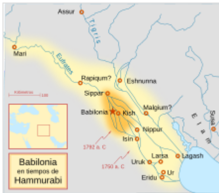
Mapa del Imperio paleobabilónico tras las conquistas de Hammurabi, hacia 1750 a. C.

Las primeras décadas del reinado de Hammurabi fueron bastante pacíficas, y utilizó su poder para llevar a cabo una serie de obras públicas, incluida la mejora de las murallas de la ciudad para propósitos defensivos y la ampliación de los templos. 20 Hacia el