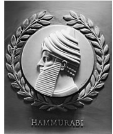
Medallón de mármol con el rostro de Hammurabi en la Cámara de Representantes en el Capitolio de los Estados Unidos .