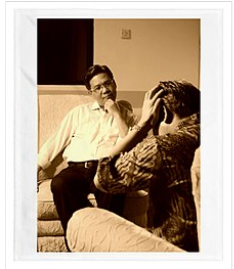
la palabra y la escucha como herramienta metodológica primordial de la Psicología Clínica

En Europa, los primeros psicólogos clínicos se establecieron en Gran Bretaña como reflejo de los sucesos en Estados Unidos. En Francia, una tradición europea fue fundada por el psicoanalista Daniel Lagache , que consideró a la Psicología Clínica como un área distinta a la Psiquiatría, que si bien integraría elementos