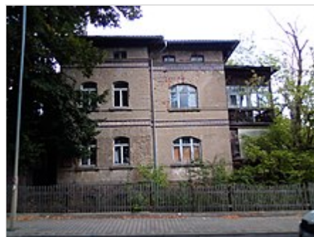
Vivienda de Wilhem Wundt, reconocido como el iniciador de la Psicología como ciencia