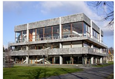
Edificio del Tribunal Constitucional Federal de Alemania en Karlsruhe

Algunos países siguen el modelo austríaco que contempla un tribunal constitucional, mientras otros siguen el modelo estadounidense de una corte suprema que ejerce las funciones de un tribunal constitucional. Así, no es inusual, como en ciertos Estados iberoamericanos , que el control de la constitucionalidad se encuentre compartido entre el tribunal constitucional y la corte suprema.