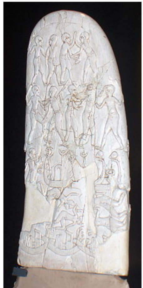
Mango de cuchillo decorado. Naqada III. Museo del Louvre.