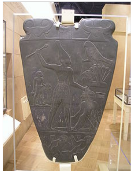
Paleta de Narmer, reproducción del Museo Real de Ontario.