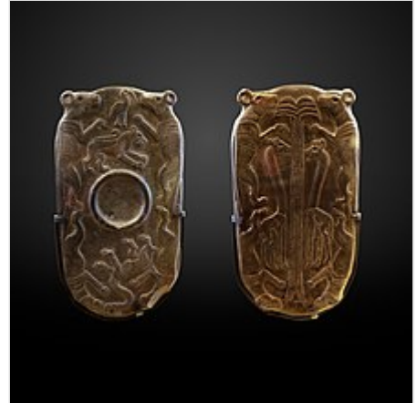
Paleta. Museo del Louvre .

El periodo Naqada III se refiere a la cultura arqueológica del periodo protodinástico de la llamada Dinastía 0 y del Dinástico Temprano de la Primera y Segunda dinastías . 7 8 Para entonces, ya existía un sistema de estado a gran escala y altamente centralizado, que abarcaba grandes partes del Alto y Bajo Egipto, aunque seguían surgiendo conflictos con las élites locales por la restauración de la anterior organización descentralizada o la asunción del poder en el estado central. 9 El primitivo estado egipcio antiguo consolidó su poder internamente y se expandió más hacia el norte, hacia el Levante meridional hasta el río Yarkon . 9 El desarrollo de una ideología real es evidente en la creciente monopolización de ciertos objetos simbólicos por parte de la élite gobernante, como las clavas con cabezas de piedra y las paletas de maquillaje , que anteriormente también se habían utilizado como símbolos comunitarios y para prácticas rituales domésticas. 10 En el entorno de esta élite surgió la Alta Cultura egipcia antigua, mientras que la desigualdad social cada vez mayor se describe como una "evolución de la simplicidad" y un "vaciamiento simbólico" del resto de la población. 10 En la tumba protodinástica U- de Abidos se encuentran por primera vez jeroglíficos . 11