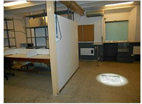
Paquetería de la Modelo, lugar de ejecución de Salvador Puig Antich. Iluminado en el suelo el lugar donde se instaló el garrote vil