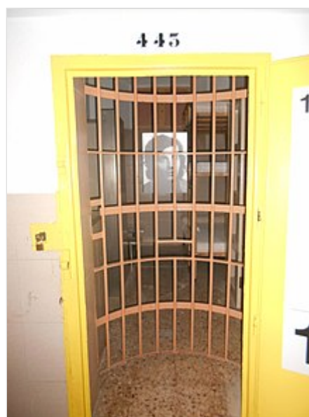
Celda de Salvador Puig Antich en la Cárcel Modelo

Puig Antich fue encarcelado, acusado de ser el autor de los disparos que causaron la muerte al subinspector del Cuerpo General de Policía en Barcelona Anguas Barragán y, posteriormente, juzgado en consejo de guerra y condenado a la pena capital "por la muerte de un funcionario público por razones políticas" . 4 Partidos políticos, colectivos de derechos humanos y mandatarios extranjeros, como la Santa Sede o el canciller alemán Willy Brandt , pidieron su indulto. Los abogados, hermanas y novia de Puig Antich coincidieron en afirmar que los partidos y sindicatos tradicionales de oposición no se movilizaron para pedir el perdón del sentenciado y así evitar su muerte o, al menos, buscar postergarla. Salvador pasó su última noche en la celda 443 de la cárcel Modelo de Barcelona , y fue ejecutado mediante garrote vil por el verdugo titular de la Audiencia de Madrid, el extremeño Antonio López Sierra , en la sala de paquetería de la prisión el 2 de marzo de 1974 a las 9:20, certificando su muerte un capitán médico a las 9:40 horas.