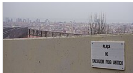
Plaza Salvador Puig Antich inaugurada en Barcelona en marzo de 2016