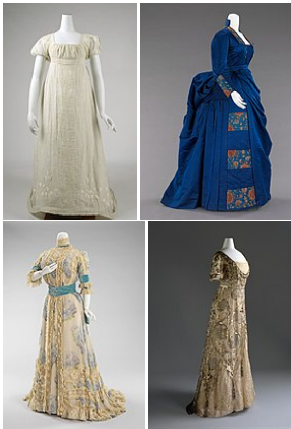
Diversos ejemplos de vestidos, de izquierda a derecha y de arriba abajo: vestido de algodón de estilo imperio de 1804; vestido de tarde con polisón de 1888; vestido de tarde de 1903; vestido de noche de 1910.

El vestido , palabra proveniente del latín vestitus , puede servir para designar un traje de mujer. 1 Si nos atenemos a una definición más estricta, un vestido se compone concretamente de una falda y cuerpo en una misma pieza y tela. Hasta los años 60 del siglo xx será considerado como un elemento básico de la moda femenina, siendo desde entonces un elemento menos frecuente en su uso, relegado en ocasiones a celebraciones especiales. 2