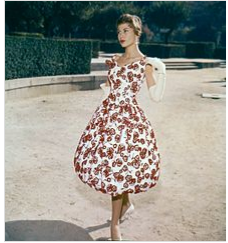
Modelo luciendo un vestido de Pedro Rodríguez , 1954.