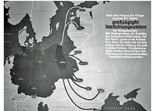
Propaganda anunciando el regreso de colonos alemanes a las tierras del imperio.

Durante la Primera Guerra Mundial, el bloqueo británico comercial a Alemania causó escasez de alimentos en Alemania y los recursos de las colonias africanas de Alemania no pudieron ayudar, esto provocó un aumento del apoyo durante la guerra a un Lebensraum que podría expandir Alemania al este hacia Rusia