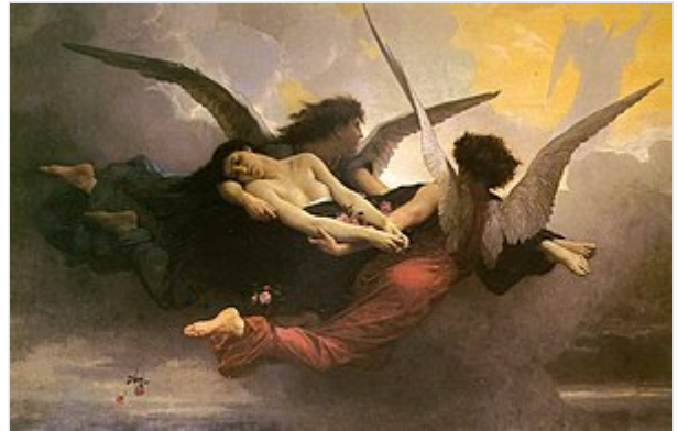
Alma llevada al cielo por dos ángeles. Representación de la tradición cristiana.

Etimológicamente, la palabra anima se usaba en latín para designar el principio por el cual los seres animados son semovientes, esto es, están dotados de movimiento propio y por tanto poseen vida . En ese sentido originario, tanto las plantas como los animales en general, el Sol, la Luna, los planetas conocidos, el viento, el fuego, el agua estarían dotados de alma ( animismo ) en proporciones distintas, por lo que algunos serían mortales (perderían su vida poco a poco) y otros no. Los avances en la fisiología , neurociencias y neurología permitieron reconocer que los seres animados obedecen al mismo tipo de principios físicos que los objetos inanimados, al mismo tiempo que pueden desarrollar actividades diferentes de estos, como la nutrición , el crecimiento y la reproducción .