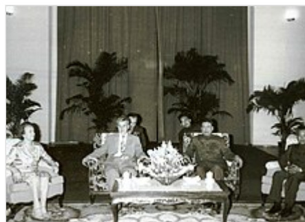
Pol Pot recibiendo a Nicolae Ceaușescu , líder de la República Socialista de Rumania , en 1978.

El 17 de abril de 1975 está marcado con la caída de Nom Pen bajo el avance de los Jemeres Rojos. Los estadounidenses tuvieron que abandonar un intento de suministrar alimentos y energía a la ciudad con un puente aéreo al estilo del de Berlín cuando el Aeropuerto Internacional de Pochentong fue blanco de intensos ataques guerrilleros, mientras el dictador Lon Nol huyó llorando por su país en un helicóptero estadounidense hacia Hawái . 31 Lon Nol nunca más regresaría a Camboya. Si bien los estadounidenses, los extranjeros de otras nacionalidades de cierta significación política y la plana mayor del dictador fueron evacuados, los estadounidenses dejaron en la sitiada ciudad mandos medios y un gran número de personas que serían carne de cañón para el nuevo régimen.