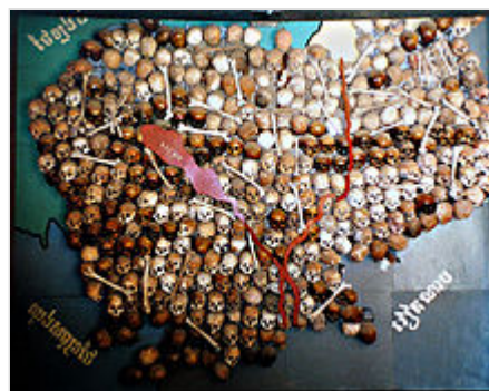
Mapa hecho con cráneos de las víctimas del régimen, exhibido en el Museo Tuol Sleng .