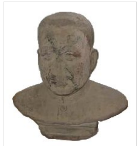
Una de las pocas imágenes de Pol Pot que sobrevivieron a la caída del régimen, conservada en el Museo Tuol Sleng en Nom Pen.

En 1982 los Jemeres Rojos , el FLNPC y el FUNCINPEC forman una coalición contra Vietnam. El príncipe Norodom Sihanouk es escogido como presidente de la Coalición, Khieu Samphan como vicepresidente y Son Sen como primer ministro. Refugiado en las selvas, Pol Pot renuncia como comandante de los Jemeres Rojos en la insurgencia en 1985, aunque retiene su supervisión. En 1987, organiza encuentros con Hun Sen , el primer ministro de la PRK y aunque se abren vías de comunicación, no se llega a acuerdos. En mayo de 1988 Vietnam anuncia planes de retirada de sus 50 000 soldados de Camboya para fin de año. En julio de 1988 los representantes de todas las partes en conflicto se reúnen en Bogor , Indonesia . Vietnam condiciona su retirada de Camboya a la completa desaparición de los Jemeres Rojos. China exige la completa retirada de Vietnam, pero no acepta ningún papel de Pol Pot en el gobierno que se ha de formar. China reprocha a la URSS su respaldo a la presencia vietnamita en Camboya. Del 30 de julio al 30 de agosto de 1989 se produce la Conferencia Internacional sobre Camboya en Francia . China promete suspender las ayudas a los Jemeres Rojos y se exige a Vietnam que se retire del país. Hun Sen queda a la cabeza del país como primer ministro.