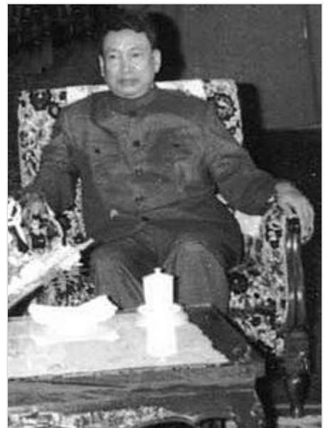
Pol Pot en 1978

Contemporáneos de Keesing. 41 Pol Pot aseguraba entonces que el enemigo, Vietnam , no se «atrevería a atacarnos» porque, según su modo de ver, Vietnam era menos potente que Camboya (posiblemente