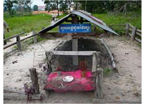
Tumba de Pol Pot.

Saloth Sar, quien había pasado a la historia como Pol Pot, murió el 15 de abril de 1998 (2 días antes del 23 aniversario de la caída de Phom Penh), a los 72 años de edad, en medio de las selvas camboyanas que en su juventud habían inspirado sus ideales. Era oficialmente prisionero del grupo que había fundado cuatro décadas atrás, los Jemeres Rojos. Los informes oficiales establecen que su muerte se debió a un ataque cardíaco, pero dado que el fallecimiento se produjo justo cuando los Jemeres Rojos anunciaron que lo iban a entregar a la Justicia Internacional, rumores de un posible atentado a su vida se presentaron como una posibilidad. Su cuerpo fue incinerado en una hoguera improvisada con cartones y neumáticos viejos, lugar que posteriormente fue rodeado por una barrera de láminas de hierro al norte del país, cerca del sitio de su muerte, a pesar de las solicitudes del gobierno de inspeccionar el cadáver , lo que suscitó sospechas de que se había suicidado tomando una sobredosis de medicamentos que le recetaron o de haber sido envenenado. La afirmación de Ta Mok de que "nadie lo envenenó" alentó la especulación de que esto era exactamente lo que había sucedido. Por lo tanto, algunas fuentes afirman que fue envenenado por sus propios compañeros.