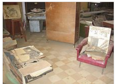
Archivos de la prisión S-21 en donde se conservan evidencias de torturas.