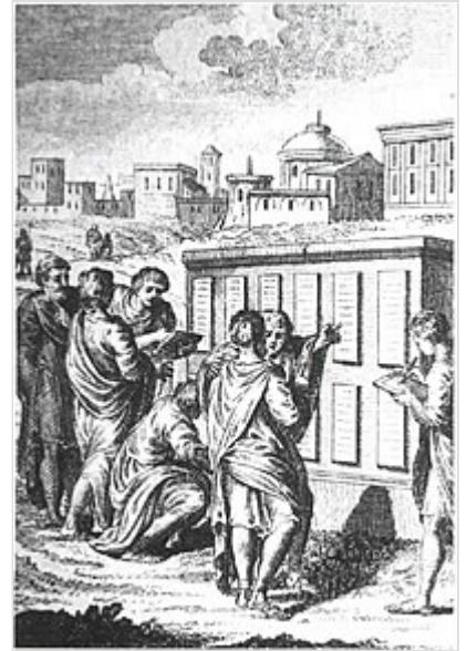
Ciudadanos romanos examinan la Ley de las XII Tablas después de su implantación.

La ejecución de la sentencia condenatoria de un deudor se regulaba muy detalladamente. Aunque resulta morbosa por ser personal y cruel, es fruto del consenso que tuvo la elaboración de las XII Tablas por parte de patricios y plebeyos ; como los deudores solían ser los plebeyos, esta regulación constituía un principio de seguridad jurídica, el plebeyo podía saber lo que le esperaba en el caso de ser insolvente.