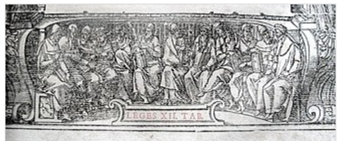
Alegoría de las XII Tablas en un ja de derecho del siglo XVI .