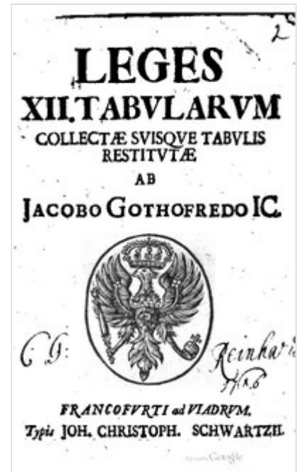
Portada de una edición de la La ley de las XII Tablas , recopiladas por Jacques Godefroy en 1641

de los magistrados patricios encargados de la administración de la justicia, y no solamente en el derecho privado, sino también en la represión de crímenes y delitos. Los tribunos , que fueron los intérpretes de las