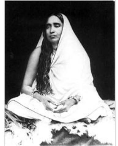
Sarada Devi (1853-1920), esposa y contraparte espiritual de Ramakrishna.