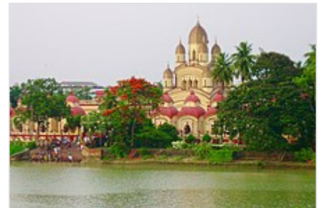
Templo Dakshineswar Kali , construido bajo la égida de Rani Rasmani en 1855. Sri Ramakrishna vivió gran parte de su vida aquí.