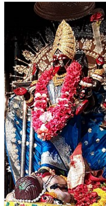
El ídolo de la diosa Kali como Bhavatāriṇi en el sanctum sanctorum del Templo de Kali de Dakshineswar .

"Yo no adoro a Kali hecha de arcilla y paja. Mi Madre es el principio consciente. Mi Madre es puro Satchidananda - Existencia-Conocimiento-Bendición Absoluta. Lo que es infinito y profundo es siempre de color oscuro. El extenso cielo es de color oscuro y también lo es el