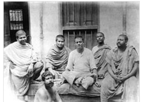
Algunos de sus discípulos (de izquierda a derecha): Trigunatitananda , Shivananda , Vivekananda , Turiyananda (en), Brahmananda , debajo Saradananda (en).

La fama de Ramakrishna trascendió y comenzó a tener discípulos. Entre ellos destacaron sus discípulos monásticos Swami Vivekananda y Swami Brahmananda , quienes después fundaron la Ramakrishna Math y la Ramakrishna Mission .