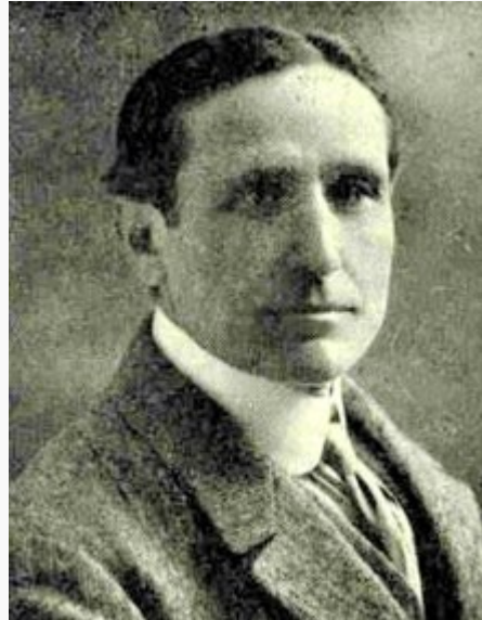
Pompeu Fabra en 1917