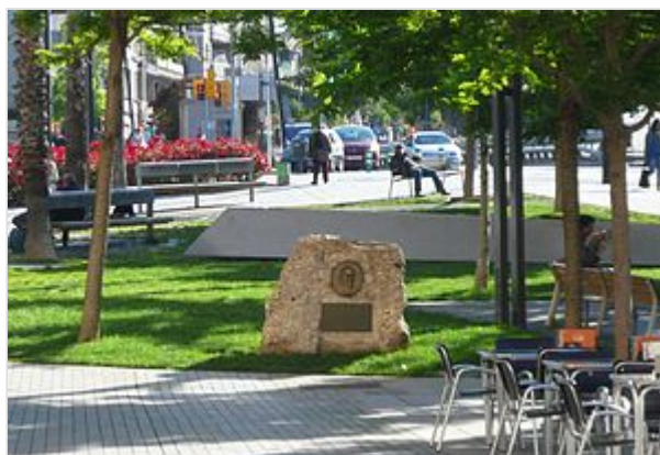
Monólito de homenaje a Pompeu Fabra en la plaza de Lesseps en Barcelona.