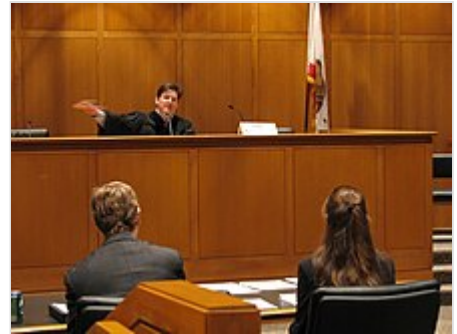
La Justicia es impartida por jueces y magistrados .

El poder judicial es un poder del Estado encargado de impartir justicia en una sociedad. Es uno de los tres poderes y funciones primordiales del Estado (junto con el poder legislativo y el poder ejecutivo ), mediante la aplicación de las normas y principios jurídicos en la resolución de conflictos . 1 Por «poder», en el sentido de poder público , se entiende a la organización, institución o conjunto de órganos del Estado, que en el caso del poder judicial son los órganos judiciales o jurisdiccionales: juzgados y tribunales , que ejercen la potestad jurisdiccional , que suele gozar de imparcialidad, autonomía y poder absoluto dentro de la ley. 2