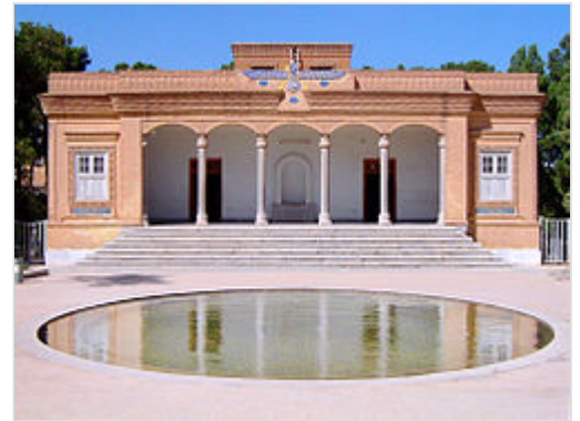
Yazd Atash Behram.

Según Heródoto (I, 131), la costumbre de los persas «es subir sobre las montañas más altas para ofrecerle sacrificios a Zeus, y dan su nombre a toda la extensión del cielo». Heródoto en Los nueve libros de la historia incluye una descripción de la sociedad iraní, que posee algunos elementos reconocibles del zoroastrismo, incluida la exposición de los muertos. Según Heródoto (I-101), los magos eran una de las seis tribus de la Media . Parecen ser la casta sacerdotal de la hoy conocida como zurvanismo , rama del zoroastrismo que adoraba a Zurvan como la deidad mayor; y que tenía una gran influencia en la corte de los emperadores medos .