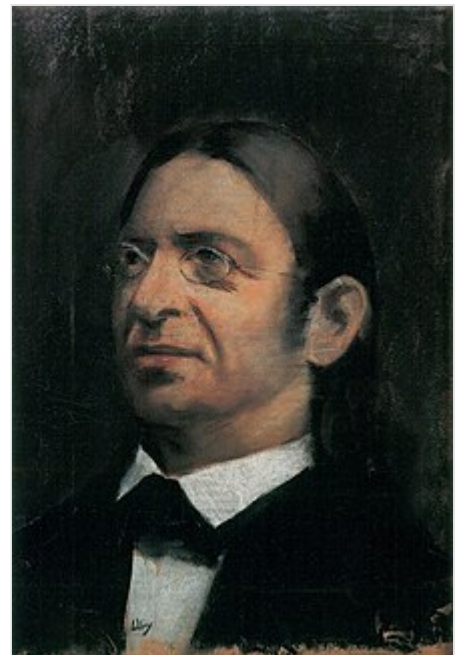
Rabino Abraham Geiger (1810-1874). Considerado el «padre» del judaísmo reformista.

El judaísmo reformista (Hebreo: יהדות רפורמית) es una de las grandes ramas de la religión judía (Judaísmo Rabínico) en la actualidad, de origen ashkenazí , junto con el judaísmo ortodoxo y el judaísmo conservador o masortí . El judaísmo reformista (también llamado progresista o progresivo ) defiende la autonomía individual en lo relativo a la interpretación de los preceptos religiosos (Hebreo: מצוות mitzvot ). 26