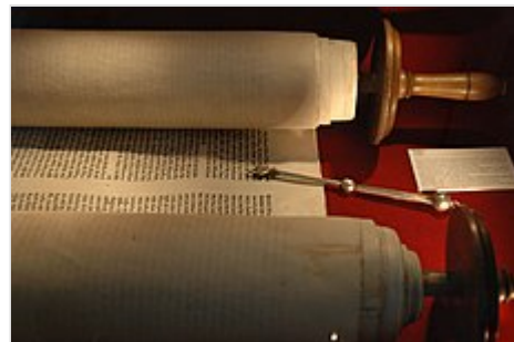
Los rollos de la Torá, abiertos para su lectura en público en la sinagoga.

El judaísmo remonta sus orígenes al pueblo de los antiguos Israel y Judá y a su relación con Dios, a quien se identifica en toda la tradición judía con el inefable nombre de YHWH . La Biblia hebrea , conocida por los judíos como Tanaj y por los cristianos como Antiguo Testamento , constituye la presentación fundamental de los orígenes y la historia primitiva del pueblo de Israel desde la creación del mundo hasta el periodo de restauración que siguió al exilio babilónico en 587/586 a. C. 16