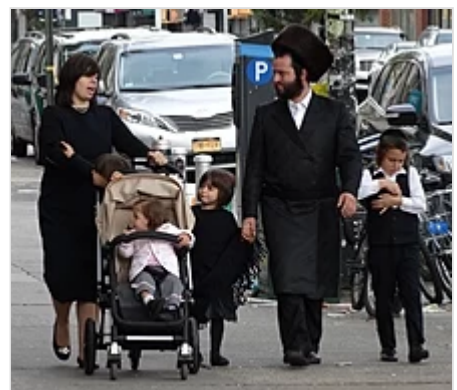
Familia jasídica en Borough Park, Brooklyn . El hombre lleva un shtreimel y un bekishe o un rekel. La mujer lleva una peluca, llamada sheitel, ya que según la ley judía, tiene prohibido mostrar su cabello a nadie después del matrimonio.

También ultraortodoxos, los mitnagdím (del hebreo מיתנגדים, oponentes), por el contrario, rechazan algunas posturas del jasidismo, como el estudio intensivo de la parte oculta de la Torá. Es una corriente más unificada.