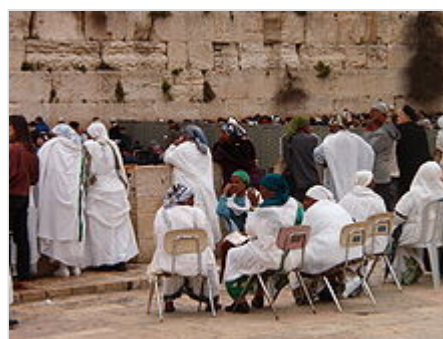
Mujeres etíopes en el Muro de las Lamentaciones .