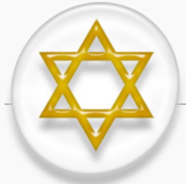
Estrella de David