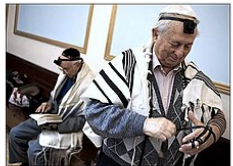
Judío ortodoxo provisto de kipá , talit gadol y tefilín , preparándose para un servicio en una sinagoga .

El judaísmo ortodoxo nació como respuesta adversa al crecimiento del judaísmo reformista en la Alemania del siglo XIX. Este se guía principalmente por la Halajá o ley judía especificada en el Talmud y codificada en el Shulján Aruj . Estos a su vez se basan en la Torá . Considera que las leyes fueron entregadas no solamente a esta generación, sino también dirigidas a todos sus descendientes, y contienen en sí todas las facetas que se puedan pensar que requieran su aplicación.