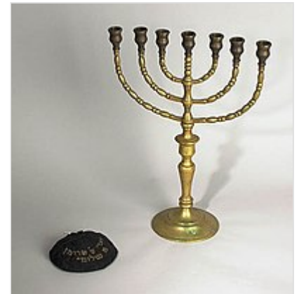
Kipá (solideo tradicional judío) y Menorá (candelabro ritual de siete brazos), dos de los más conocidos símbolos de la tradición judía .