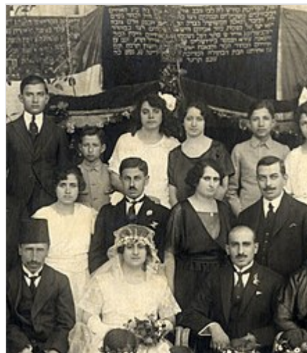
Boda judía en Alepo , Siria , 1914.