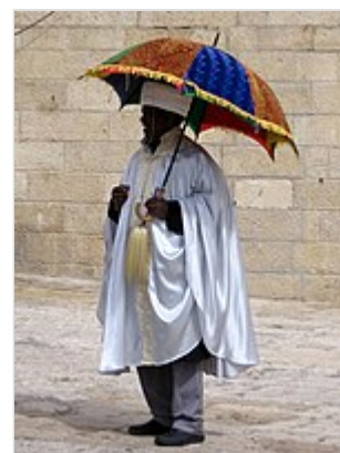
Judío de origen etíope en el muro occidental.

Haymanot (que significa "religión" en ge'ez y amárico) se refiere al judaísmo practicado por los judíos etíopes, conocidos como Beta Israel . Esta versión del judaísmo difiere sustancialmente de los judaísmo rabínico, caraíta y samaritano, ya que los judíos etíopes se separaron antes de sus correligionarios. Las escrituras sagradas (el Orit ) están escritas en ge'ez, no en hebreo, y las leyes dietéticas se basan estrictamente en el texto del Orit, sin explicación de comentarios auxiliares. Los días festivos también difieren, con algunos días festivos rabínicos que no se observan en las comunidades judías etíopes y algunos días festivos adicionales, como Sigd. 36 5 6