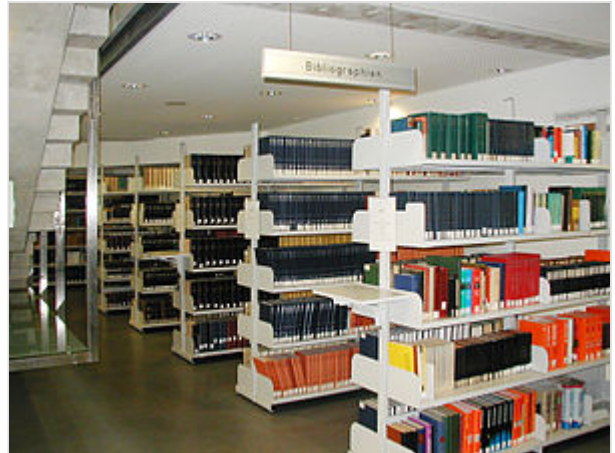
Bibliografías en la Biblioteca Universitaria de Graz

La bibliografía (del griego βιβλίο biblíō : ‘libro’, y γράφω gráfo : ‘escribir’) es el estudio, descripción y clasificación de documentos, con el objetivo de producir la compilación de las fuentes documentales de un trabajo intelectual o un catálogo de obras sobre un tema específico. El término bibliografía hace mención expresa a libros, pero en la práctica los documentos pueden ser tanto manuscritos, impresos, digitales o audiovisuales, estén o no publicados. 1 También se denomina bibliografía a la propia compilación o catálogo de referencias bibliográficas. 2