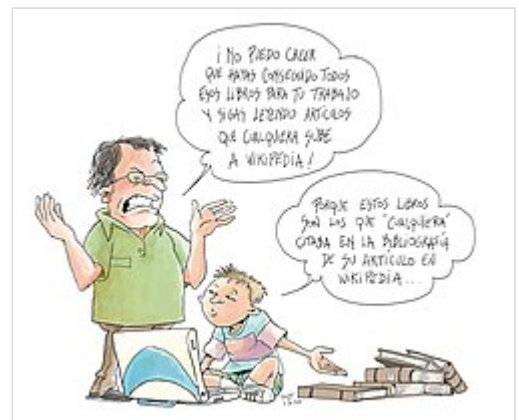
Viñeta sobre bibliografía.