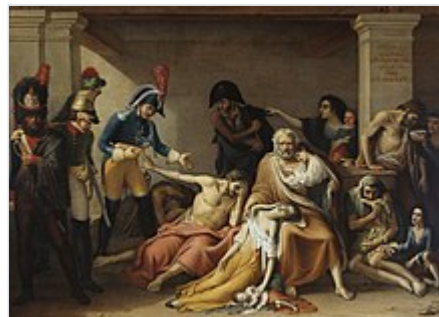
Pintura titulada El hambre en Madrid , 1818, de José Aparicio . La obra representa el hambre padecida por los ciudadanos de Madrid durante la ocupación napoleónica , en concreto representa a un grupo de ciudadanos rechazando la ayuda de los soldados invasores.