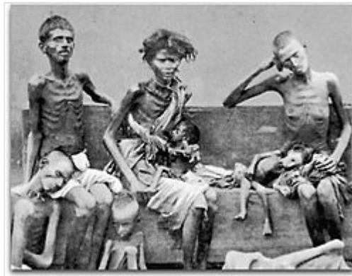
Fotografía de personas sufriendo los efectos de la hambruna en India hacia (1877).