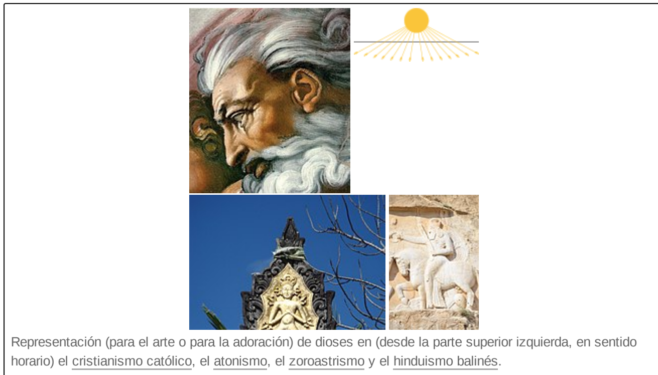
Representación (para el arte o para la adoración) de dioses en (desde la parte superior izquierda, en sentido horario) el cristianismo católico , el atonismo , el zoroastrismo y el hinduismo balinés .

El concepto teológico , filosófico y antropológico de Dios nota 1 (del latín : Deus , que a su vez proviene de la raíz protoindoeuropea *deiwos~diewos , ‘brillo’, ‘resplandor’, 2 al igual que el sánscrito deva , ‘ser celestial’, ‘dios’) hace referencia a una deidad suprema. El Diccionario de la lengua española lo define como el «ser supremo que en las religiones monoteístas es considerado creador del universo ». 1