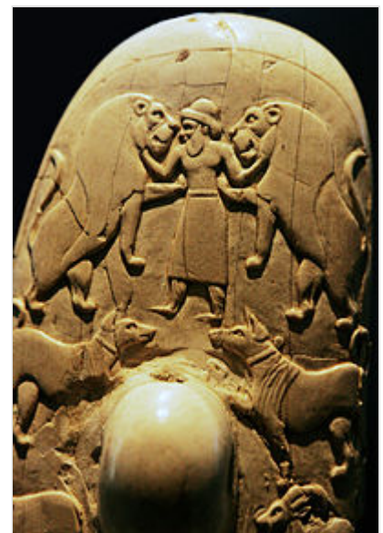
Imagen del dios El venciendo a dos leones, tallado en el mango del cuchillo ceremonial de Gebel el-Arak . Según una palabra semítica del noroeste , que tradicionalmente se traduce como 'Dios', refiriéndose a la máxima deidad. Algunas veces, dependiendo del contexto, permanece sin traducción (quedando simplemente El) para referirse al nombre propio de Dios.