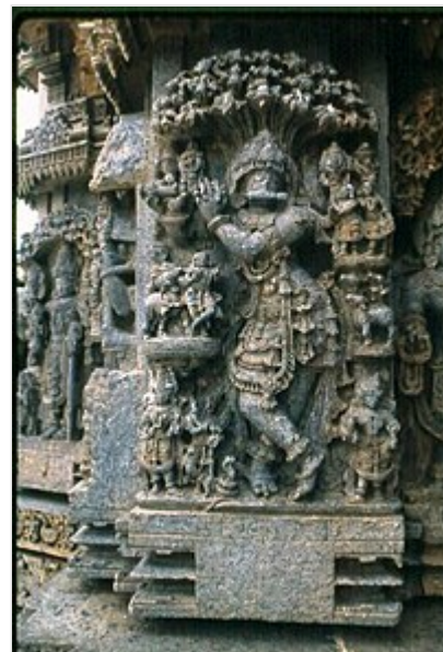
Imagen de Krishna , el Dios creador según el hinduismo tocando la flauta, cubierto por la serpiente-dios Ananta Shesha . Bajorrelieve en el templo de Somnathpur , en Karnataka (India).