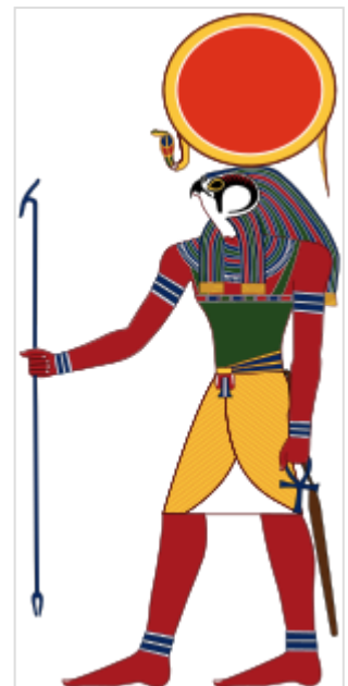
El dios Ra, era dios del cielo, dios del Sol y del origen de la vida según en la mitología egipcia .