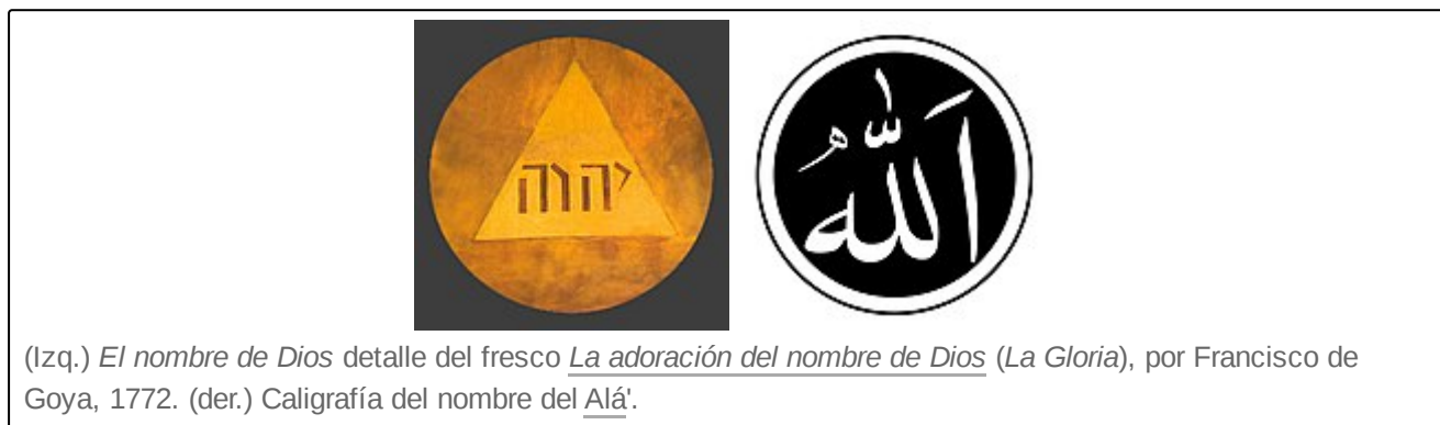
(Izq.) El nombre de Dios detalle del fresco La adoración del nombre de Dios ( La Gloria ), por Francisco de Goya, 1772. (der.) Caligrafía del nombre del Alá .

Dios es el nombre que se le da en español a un ser supremo omnipotente , omnipresente , omnisciente y personal en religiones teístas y deístas (y otros sistemas de creencias ) quien es: o bien la única deidad, en el monoteísmo , o la deidad principal ( monolatría ), en algunas formas de politeísmo , como en el henoteísmo . 3