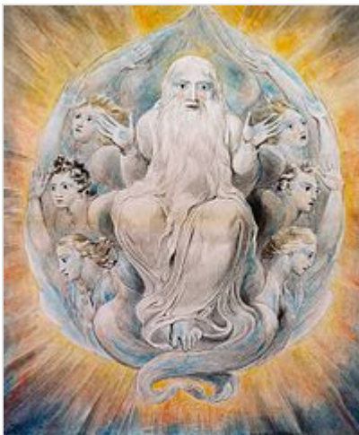
La Obra "Dios bendijo el séptimo día", una acuarela de la versión deísta de Dios por William Blake (1757-1827).

Pueden darse, según las distintas visiones, características variadas y no siempre armonizables entre sí. Además, hay quienes creen en un Dios personal , basándose en argumentos filosóficos, pero sin necesidad de acudir a una religión ( Deísmo ), mientras otros consideran a Dios con argumentos religiosos sin excluir otros argumentos como filosóficos, un ser con el cual tratan y esperan una acción salvadora a favor de los seres humanos ( Teísmo ).