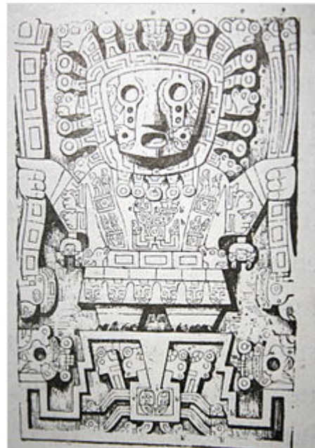
Apu Qun Tiqsi Wiraqucha o el Dios Viracocha en la cultura incaica, es el creador. En quechua, apuj' significa señor, tiqsi significa fundamento, base, inicio; mientras que wiraqucha proviene de la fusión de dos vocablos: wira (metátesis de wari = sol) 1 y qucha (contenedor de agua, lago, laguna). Ilustración última de El templo del Sol , de Hergé .