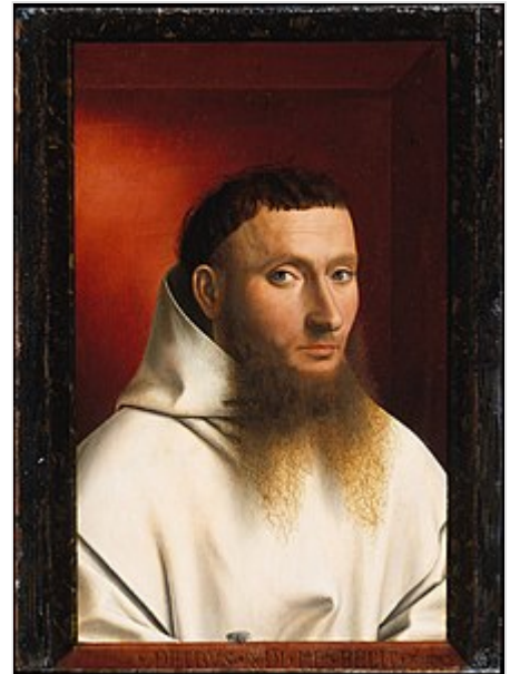
Monje cartujano según la famosa pintura Retrato de un cartujo .

Pío XI. Constitución Apostólica Umbratitem vitam , de 1924