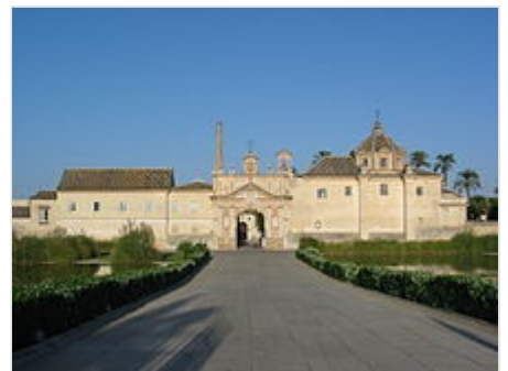
Monasterio de la Cartuja, antigua cartuja en Sevilla, Andalucía, España.