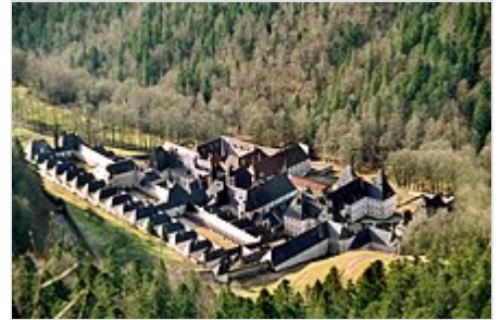
La Grande Chartreuse, cerca de Grenoble, en Francia.