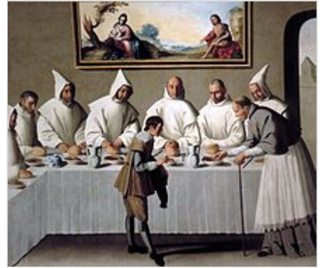
Pintura del claustro cartujo del monasterio de Santa María de las Cuevas, Sevilla por Francisco de Zurbarán . La escena muestra a Hugo de Grenoble en un monasterio cartujo.