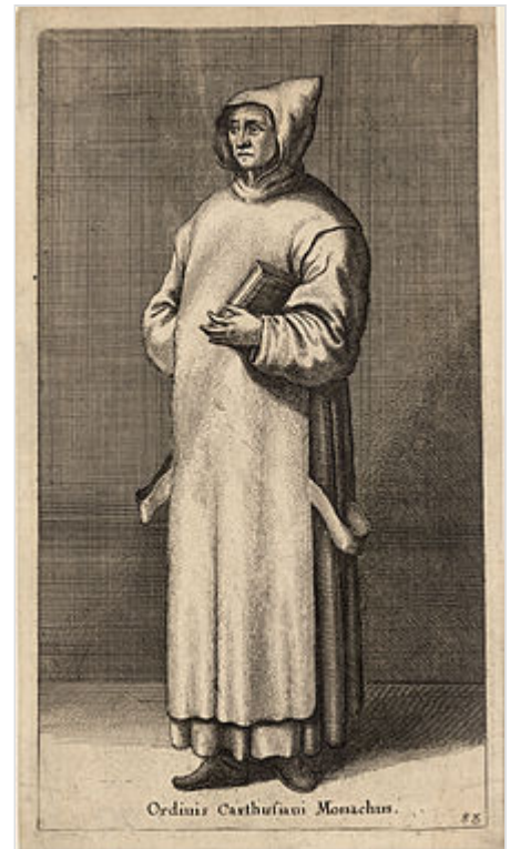
Hábito cartujo, siglo XVII

En la vida diaria de un monje cartujo hay actividades que varían en cada cartuja. Lo fundamental son los oficios a los que se ajusta la jornada del cartujo. El monje asiste diariamente a los oficios: maitines , laudes , prima , tercia , sexta , nona , vísperas y completas . Cada hora del oficio del día es precedida o seguida del oficio de la Santísima Virgen.