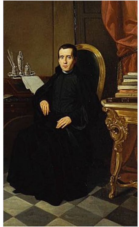
Retrato de Jaime Balmes (detalle), pintado en 1848 por Luis Brochetón y Muguruza ( Real Academia de la Historia , Madrid).

Por ello, Balmes defiende que la metafísica no debe sostenerse solamente sobre una columna, sino sobre tres que se corresponden con las tres verdades: así, el principio de conciencia cartesiano, el cogito ergo sum es una verdad subjetiva, mientras que el principio de no contradicción aristotélico es verdad racional. Finalmente, el sentido común, el instinto intelectual (tal vez sea «instinto intelectual» un término más específico que «sentido común») nos presenta la llamada verdad objetiva. Es imposible encontrar una verdad común a los tres principios.