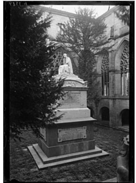
Monumento a Jaime Balmes en el claustro de la catedral de Vic , realizada por Josep Bover en 1865.

La evidencia no capta un hecho, sino que capta sus relaciones. Se capta que la idea del predicado está en el sujeto (de forma similar al juicio analítico de Kant ). Toda evidencia se funda en el principio de no-contradicción, y se reduce a lo analítico. Olvida los juicios sintéticos que no son exclusivamente racionales,