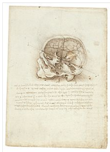
Pintura anatómica del cráneo humano, Leonardo da Vinci .

En el siglo xix surgió por primera vez el concepto de « enfermedad mental » y la psiquiatría hizo su ingreso definitivo a la medicina . Hasta el siglo xx los enfermos mentales eran recluidos en asilos donde recibían « tratamientos morales » con el fin de disminuir su « confusión mental » y « restituir la razón ». En los años treinta se introdujeron varias prácticas médicas controvertidas, incluyendo la inducción artificial de convulsiones 6 (por medio de electroshock, insulina y otras drogas) o mediante cercenar porciones del cerebro (lobotomía o leucotomía). Ambos procedimientos se usaron ampliamente en psiquiatría, pero hubo mucha oposición basadas en cuestionamientos morales, efectos nocivos o mal uso. En los años cincuenta nuevas drogas, especialmente el antipsicótico clorpromazina, fueron diseñadas en laboratorios y gradualmente suplantaron a los tratamientos más controvertidos.