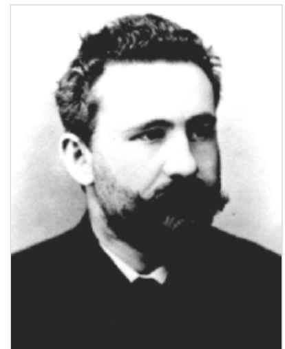
Kraepelin creador de categorías nosográficas que han organizado los criterios diagnósticos en Psiquiatría durante décadas