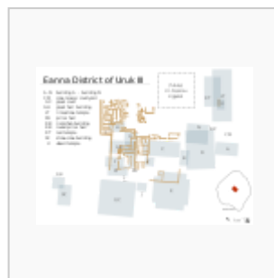
Planta de Eanna III