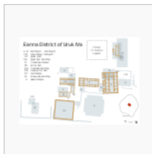
Planta de Eanna IVa