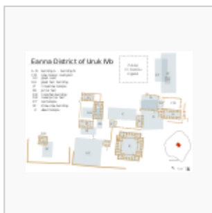
Planta de Eanna IVb