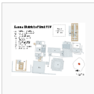
Planta de Eanna VI-V