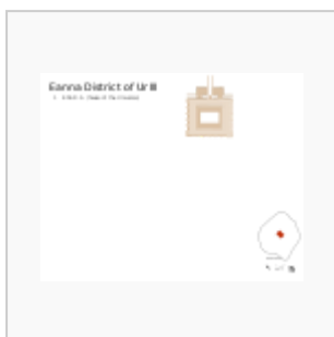
Planta de la Eanna Neosumeria