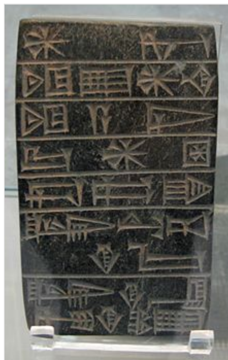
Tablilla de fundación del Templo de Inanna, que data del reinado de Ur-Nammu. British Museum .