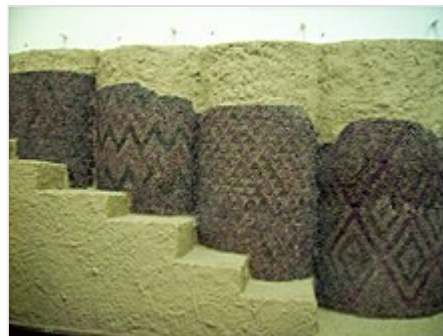
Decoración de mosaicos del templo dedicado a Inanna en el nivel IV de Uruk. c. 3100 a. C. ( Museo de Pérgamo , Berlín .)

Uruk tendría dos complejos de culto: Eanna y Kullab . Las excavaciones alemanas han encontrado hasta 18 niveles en el sector del conjunto cultural de Eanna. El primer edificio de entidad de Eanna, el "Templo de los Conos de Piedra" (Templo de los Mosaicos), fue construido en el período VI de Uruk (anterior al 3400 a. C.), sobre un templo preexistente del período El Obeid y podría tener una función ritual . Estaba formado por una nave central y dos pasillos y estaba rodeado por un muro de piedra caliza con un elaborado sistema de contrafuertes . Se le llamaba así por el