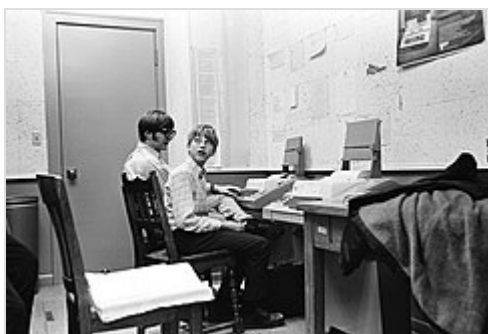
Allen (izquierda) junto a Bill Gates en Lakeside School, 1970

Asistió a la Lakeside School , una escuela privada ubicada en Seattle , y se hizo amigo de Bill Gates , quien era tres años más joven y compartió un entusiasmo común por los ordenadores. 4