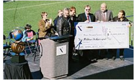
Paul Allen entregando el premio Ansari-X.

Su compañía de posesiones tiene una capacidad de desarrollo de más de 930 000 m 2 de nuevo espacio de investigación de viviendas, oficinas, locales comerciales y la biotecnología. La urbanización Unión Lago Sur representa uno de los mayores proyectos de revitalización urbana en el país. Allen realizó inversiones estimadas en EE. UU. de unos 200 millones de dólares a partir de 2005, y promovió la financiación del tranvía de la línea de Seattle , conocido como South Lake Union tranvía, que va desde Seattle Westlake Center hasta el extremo sur del Lago Union.