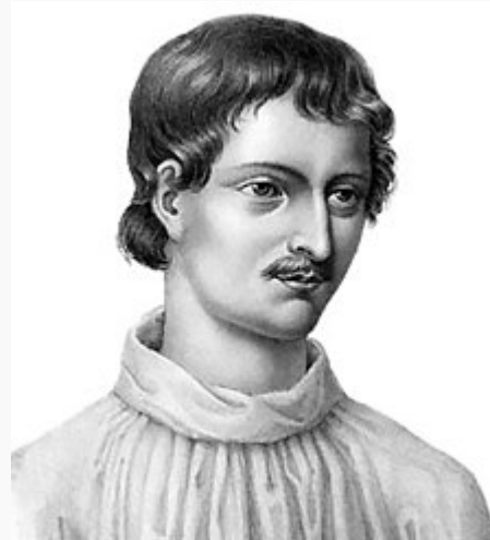
Retrato moderno de Giordano Bruno basado en una ilustración de una obra de 1578