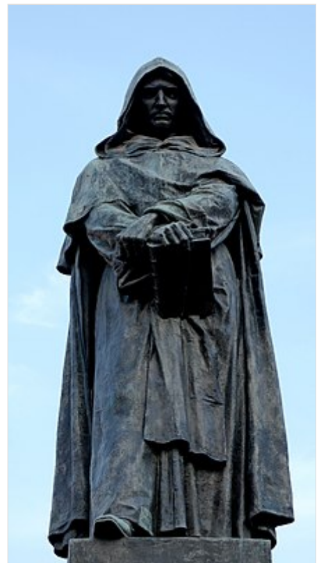
Estatua de Giordano Bruno, por Ettore Ferrari, Campo de' Fiori, Roma.

El historiador de la ciencia Alexandre Koyré considera que la «audacia» del pensamiento bruniano «causó una transformación —una verdadera revolución— en la imagen tradicional del mundo y de la realidad física», habiendo propuesto una visión del universo cercana a la posteriormente desarrollada por Newton .