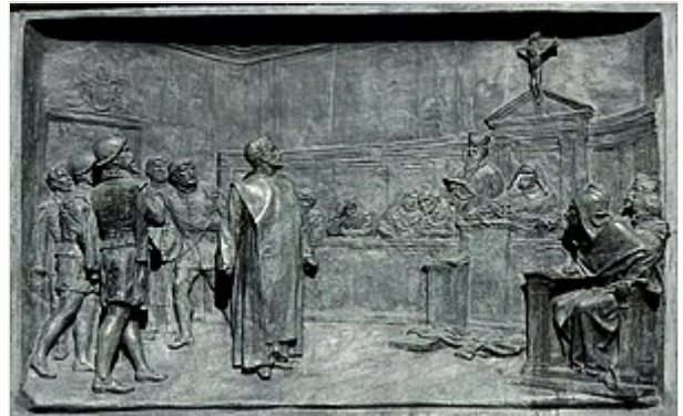
El proceso de Giordano Bruno a cargo de la Inquisición romana. Relieve de bronce de Ettore Ferrari (1845-1929), Campo de' Fiori, Roma.