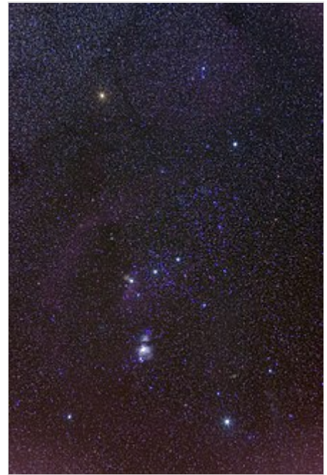
La constelación de Orión .

Bruno también defendió el atomismo , recuperando los conceptos materialistas de la Antigüedad . Esto se expone en varias de sus obras, especialmente en De triplici minimo et mensura , donde sostiene que todos los compuestos físicos mutan y retornan a los mínimos o átomos , de los cuales a su vez surgen nuevos cuerpos que reconfiguran el universo una y otra vez (la conocida como «alternancia vicisitudinal», en lenguaje bruniano), y señalando a la aritmética , la geometría y la física como las tres ramas básicas del conocimiento . 29