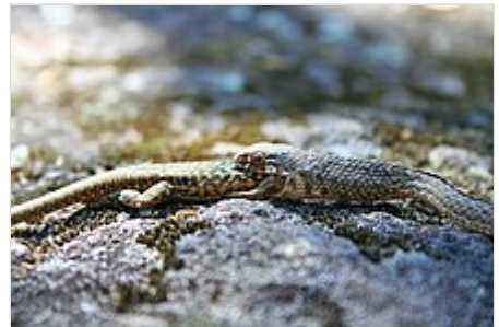
Culebra bastarda ( Malpolon monspessulanus ) alimentándose de una lagartija ibérica ( Podarcis hispanica ).