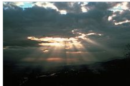
Platón compara el Sol con la Idea del Bien. En muchas culturas el sol es una analogía con Dios.

Platón es el primer filósofo que realiza un planteamiento unificado de los modos de existir: